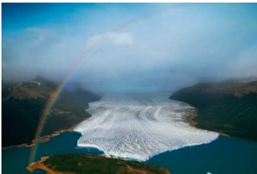
Glacier Perito Moreno, Argentine (46°36' S - 70°56' O).

Dans le monde, les glaciers de montagne ont perdu la moitié de leur volume en 150 ans.